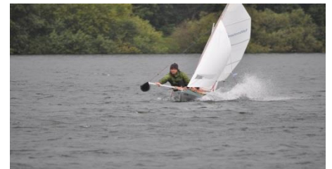
„Dresdener Faltbootensemble“ in voller Fahrt (Archivbild)

Am Freitagabend trudelten nach und nach viele Teilnehmer im KCH zum Bratwurstessen, Biertrinken und auch Fachsimpeln ein. Tolle, für uns neue und unbekannte Boote konnten bestaunt