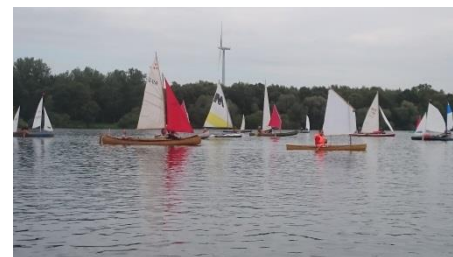
Das Feld zieht sich nur sehr langsam auseinander

Beeindruckend dann auch der Start, anders als in den vorangegangenen Jahren bleibt das Feld der Segler lange zusammen, so dass zumindest aus fotografischer Sicht einige sehr schöne Aufnahmen gemacht werden können.