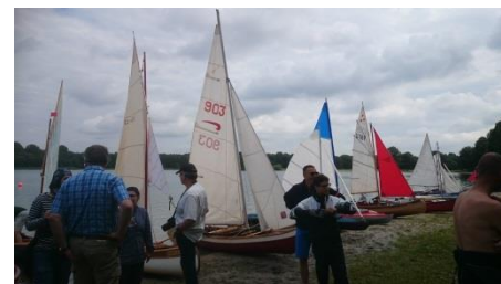
Segelnummer 903, „The Weapon of Choice“ der Goens-Brüder

Entgegen der letzten zwei Male, ist der Wind, wie bereits vielfach prognostiziert, schwach. Leichte Rumpfe, gewaltige Riggs und viel Segelfläche sollen diesmal das Rennen entscheiden.