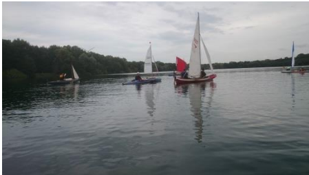
Vaart houden, niet knijpen! Goens-Brüder zu hart am Wind!

Obgleich das Rigg der Goens-Brüder einschüchternd groß ist, gelingt es ihnen nicht, sich an die Spitze des Rennens zu setzen. Kurz vorm Ziel bleiben sie bei einem Wendemanöver hängen. Die Devise der alten Torschiffer lautet im Zweifelsfall: „Fahrt halten, nicht kneifen!“