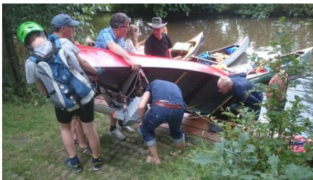
Plackerei nebst Havarie und Badeinsatz

Auf dem Weg zum Unisee zog sich das Feld schnell auseinander, wurde jedoch an der Umtragestelle wieder zusammengeführt. Das Umtragen war wie in jedem Jahr eine Mords- Plackerei.