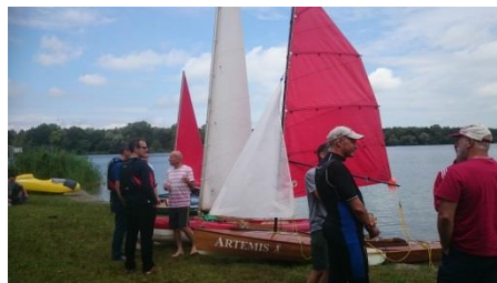
„Artemis“ am Strand