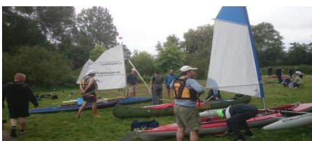
Aufbau der Boote am Unisee

Am Unisee konnten wir auch unsere Mitbewerber aus Walle, Marienbrücke, Mac-Pom, USA und dem restlichen Umland begrüßen.