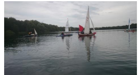
An der Wendemarke