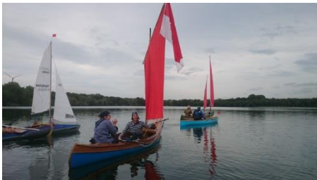
Das „Amazonen-Team“ – Schnell und gefürchtet!

Früh am Morgen ging es für die im KCH Übernächtigten zunächst zum Frühstück. Dies konnte in Ruhe vor dem großen Ansturm der restlichen Segler eingenommen werden. Nachdem auch das Amazonen-Team kurz vor 10.00 Uhr eintraf konnte sich die Armada endlich in der Schleuse sammeln.